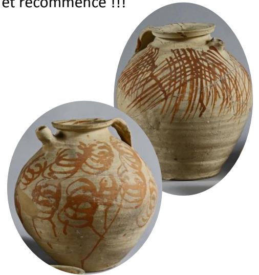
Cruches en terre cuite peinte, 10 - 11 ème siècles