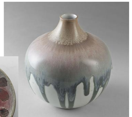
Auguste Delaherche, Vase boule