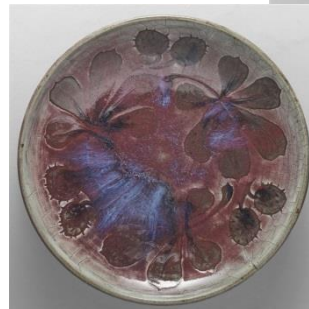
Auguste Delaherche, Plat