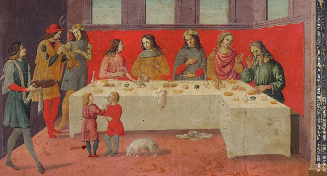
Niccolò, 806 Ch. Ecole de la Banque, vers 1305. Donné à Chalais, Fontaine Chalais (M.A.C.P. 22)