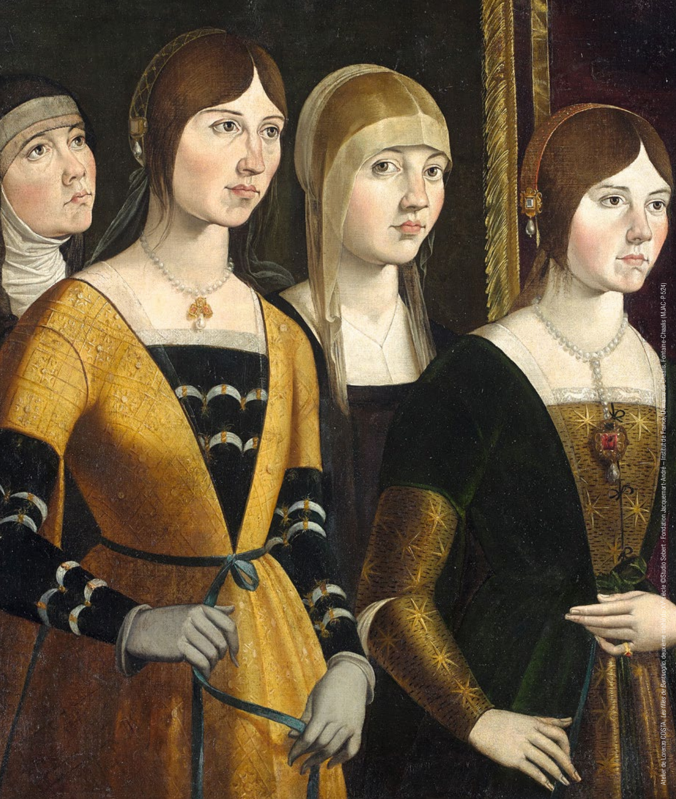
Atelier de Lorenzo COSTA, Les filles de Beatrice, deuxième moitié du XVI e siècle ©Studio Sabert - Fondation Jacquemart-André - Institut de France, Domaine de Chalais, Fontaine-Chalais (MJC-P-524)