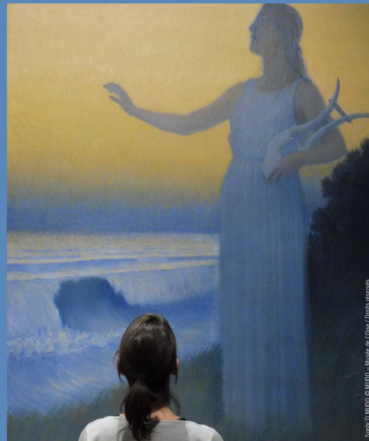
Sophr'O MUDO

> Vendredi 28 mars, 25 juillet et 26 décembre à 12h00