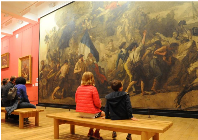
La salle Thomas Couture

Présentée dans l'ancienne salle de réception de l'évêque, l'impressionnante toile inachevée de Thomas Couture, L'Enrôlement des volontaires de 1792 , rénovée grâce au mécénat participatif, déploie ses 45 m 2 aux côtés de nombreuses études préparatoires.