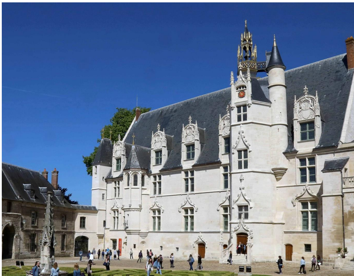
Le palais Renaissance

Situé au pied de la cathédrale de Beauvais, le MUDO-Musée de l'Oise est installé dans l'ancien palais des évêques-comtes de Beauvais, édifié au 12 e siècle par Henri de France, frère du roi. Après plusieurs années de rénovation alliant valorisation patrimoniale et aménagement contemporain, le musée présente au cœur du palais épiscopal une magnifique sélection de sa collection du 19 e siècle .