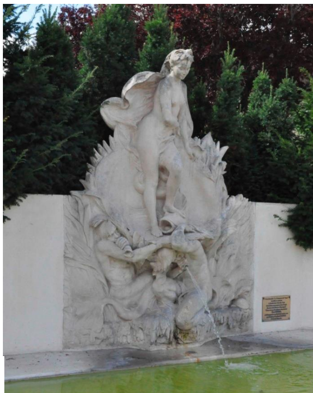
Fontaine La Naissance de Vénus , place Foch

En 1994, le MUDO-Musée de l'Oise présentait la première rétrospective consacrée à Henri Gréber, élève de Frémiet et de Mercié, à l'occasion de l'exposition dédiée à cette famille incontournable d'artistes beauvaisiens. Le musée possède dix-huit œuvres de l'artiste dont de nombreuses représentations de famille ou de proches (sa mère, sa sœur, son frère Charles..), quelques portraits en pied à la «Gréber» (Frémiet, le Docteur T. Baudon) ou des tirages d'œuvres monumentales comme Narcisse (plâtre patiné d'après le modèle du Salon des Artistes Français de 1908, aujourd'hui détruit).