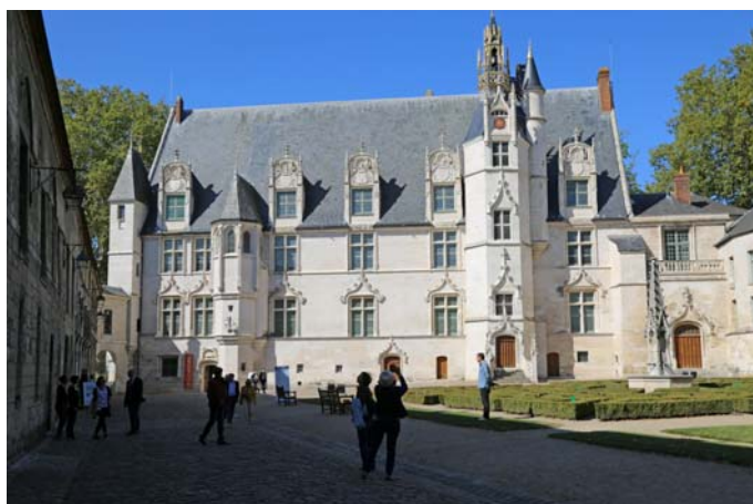
Le palais Renaissance du MUDO-Musée de l'Oise

Catalogue d'exposition en vente à la boutique du musée (6 €).