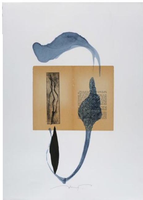
Sans titre, Joël Leick, 2018

Le MUDO-Musée de l'Oise rend hommage aux 35 ans d'édition de Bernard Dumerchez, éditeur d'art de l'Oise.