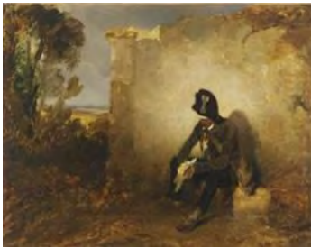
G. Decamps, Le vieux garde-chasse Gassois à Hermenonville