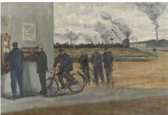
René Charles BELLANGER, La pointeuse , 1927