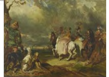
Alfred Dedreux, Scène de chasse sous Charles VII