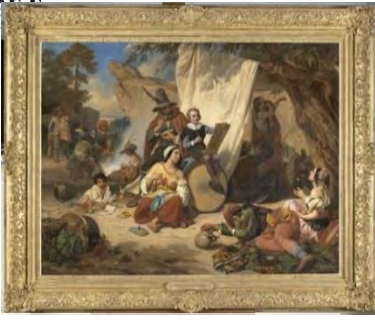
C. Debacq, L'enfance de Callot