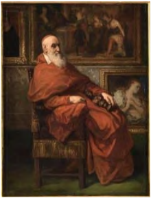
J. Robert-Fleury, Un cardinal