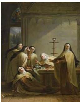
Louis COUDERC, Vert-Vert , 19 e siècle