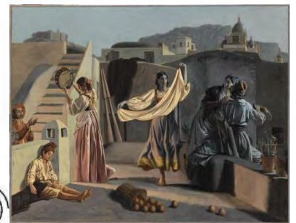
Aurèle Robert, Terrasse à Capri