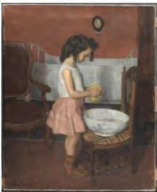
Maurice BOUDOT-LAMOTTE, Cécile jouant ou La petite tripoteuse , 1909